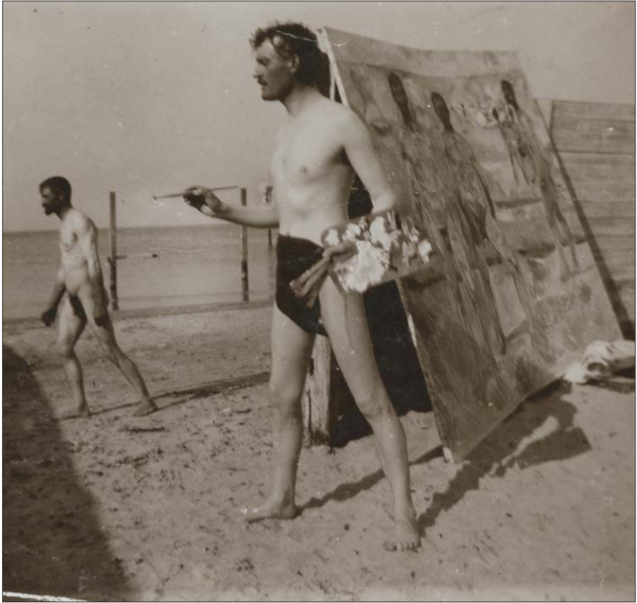
Edvard Munch maler på stranden i Warnemünde i Tyskland. Fotografisk selvportrett (1907), Munchmuseet, Oslo (Edvard Munch pinta en la playa de Warnemünde en Alemania. Autorretrato fotográfico, 1907)